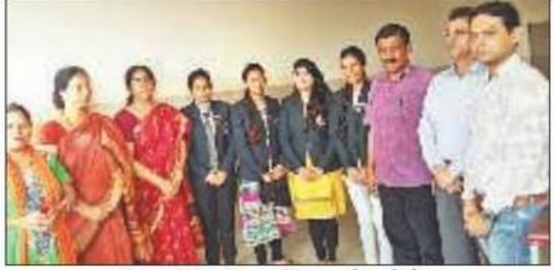
पांवटा कॉलेज में नव गठित एससीए की टीम।