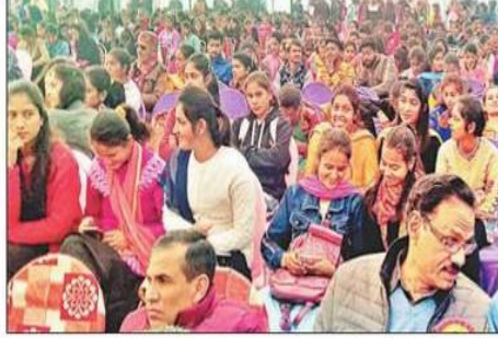
पांवटा साहिब कॉलेज के रजत जयंती समारोह में उपस्थित विद्यार्थी।