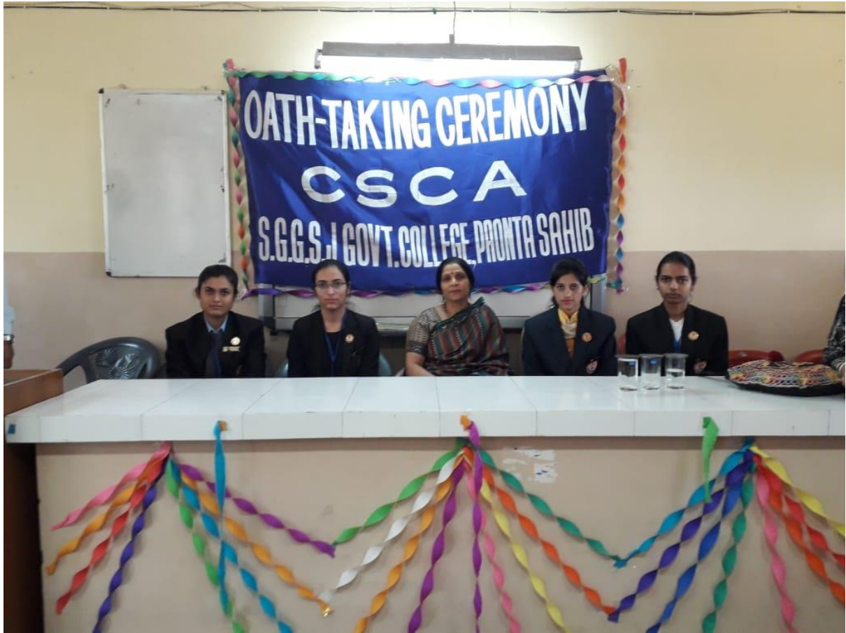
Photograph 2 CSCA 2018-19 with Principal