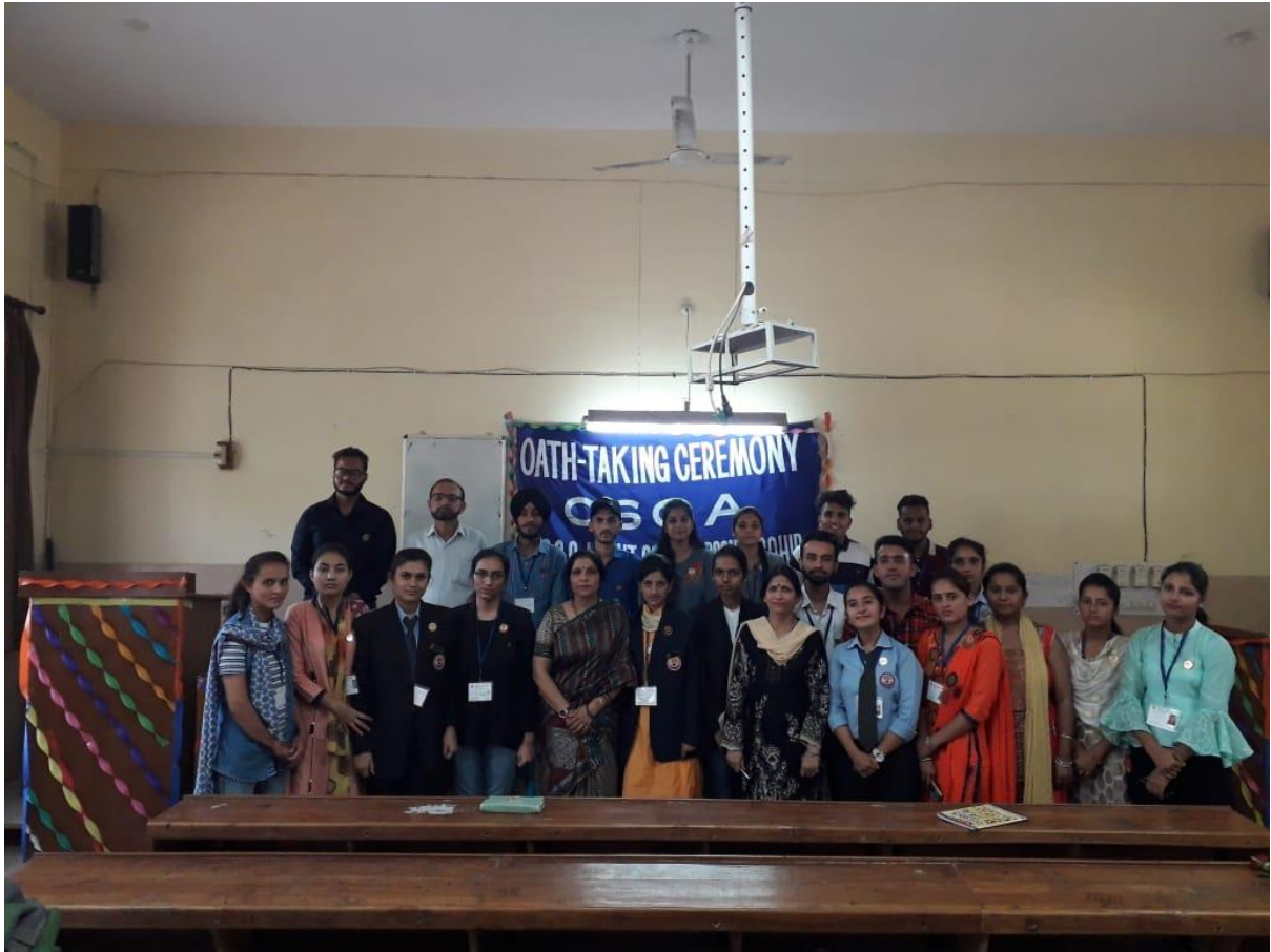
Photograph 1 CSCA 2018-19 with Principal and staff members